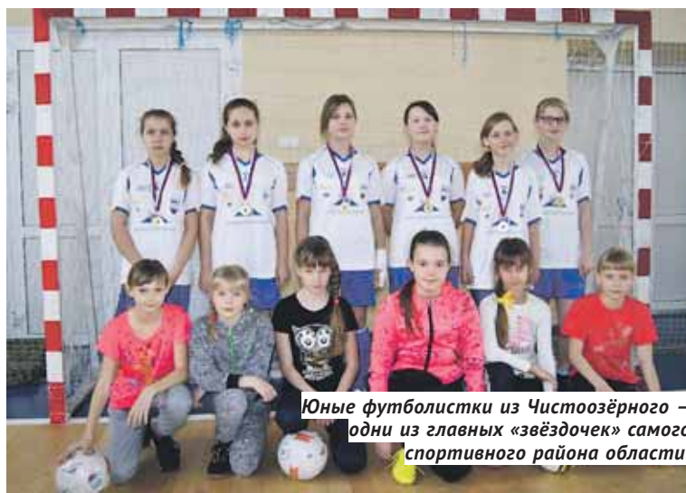
Юные футболистки из Чистоозёрного — одни из главных «звёздочек» самого спортивного района области.

Повышают репутацию одного из самых спортивных районов региона и юные футболистки. Да, футбол принято считать мужским или юношеским видом спорта, но местным спортсменам ещё стоит поучиться у девочек из команды «Триумф». Команда — неоднократный победитель областных соревнований и чемпион области в турнире «Кожаный мяч». Кроме того, юные спортсменки несколько раз выступали в финале Общероссийского проекта «Мини-футбол в школу» по Сибирскому феде-