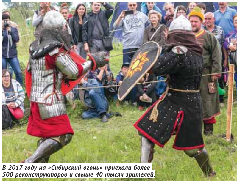
В 2017 году на «Сибирский огонь» приехали более 500 реконструкторов и свыше 40 тысяч зрителей.